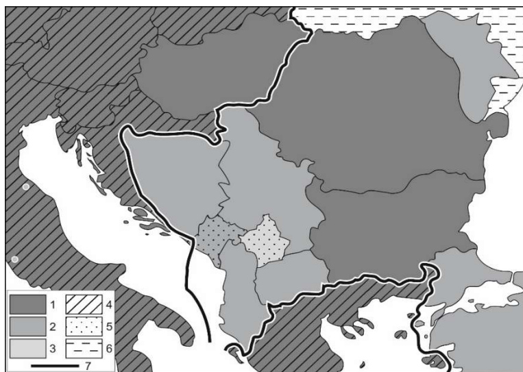
1. ábra: Délkelet-Európa EU-integrációs viszonyai, 2023

Figure 1: EU integration relations in Southeast Europe, 2023