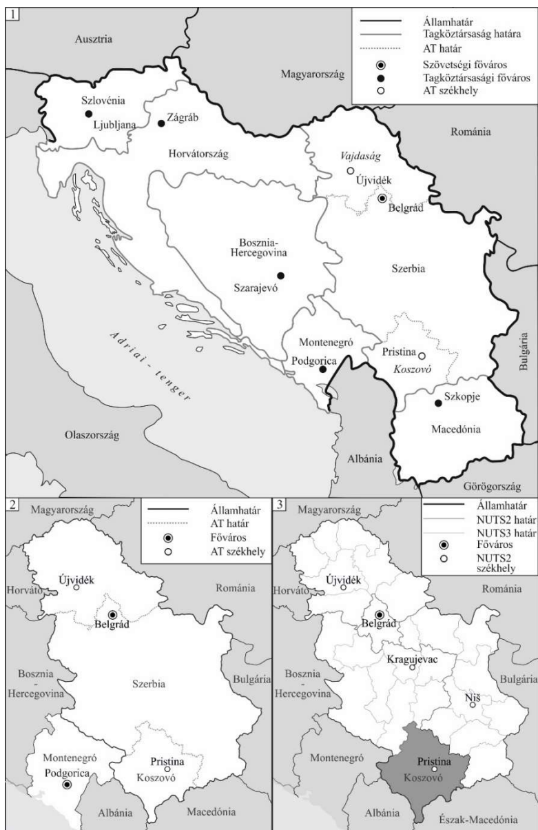
3. ábra: Szerbia államföldrajzi változásai 1991 óta

illetve Dél- és Kelet-Szerbia (továbbá de jure ide tartozik Koszovó-Metohija).