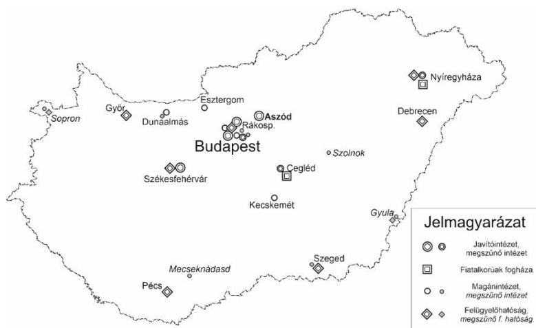
13. ábra A gyermekvédelmi intézményhálózat Magyarországon 1920-1937

Fig. 2 The Child Protection Institutional Network in Hungary (1920–1937)