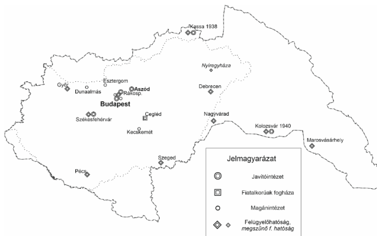
14. ábra A gyermekvédelmi intézményhálózat Magyarországon 1938-1945

Fig. 3 The Child Protection Institutional Network in Hungary (1938–1945)