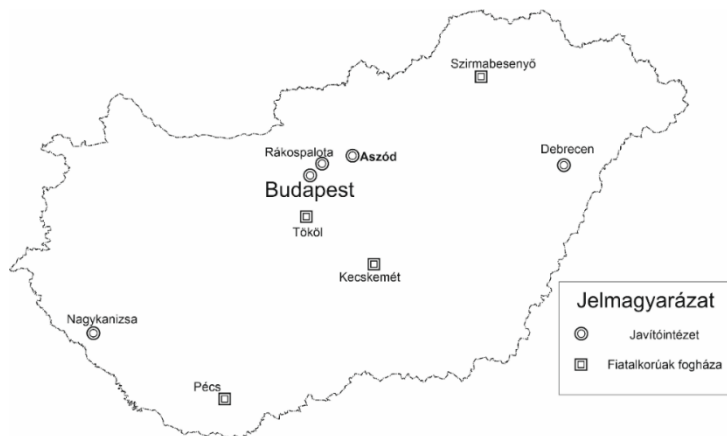
16. ábra A fiatalkorúak javító- és büntetésvégrehajtási intézetei 1990-2022