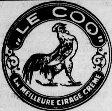
A világ legjobb cipókrémje.