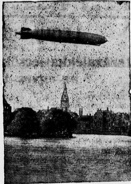
A ZEPPELIN KELETEURÓPAI UTJA Mint jelentettük, a Zeppelin keleteurópai útja során elszállt Belgrád, Bukarest, majd hazafelé térőben Budapest felett is. A felvétel a Zeppelin: Bukarest feletti útját örökítette meg.