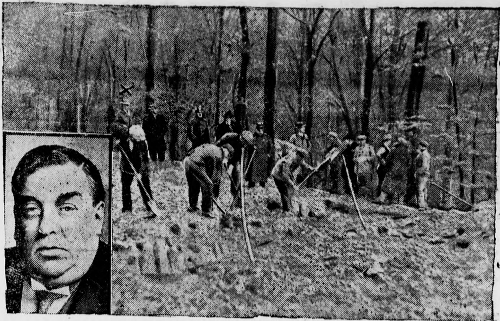
Keresik a düsseldorfi kéjgyilkos áldozatainak holttestét