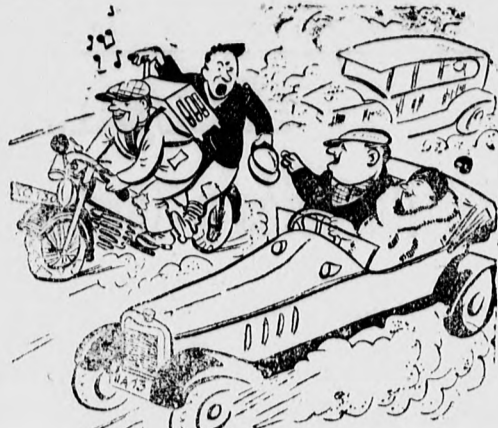
Haladni kell a korrall

Arcbörét bársonysímává csak „Szent Anna Arcfinomító” szappan teszi, kizárólag a KISÉRI PATIKÁBAN kapható ára 70 f.