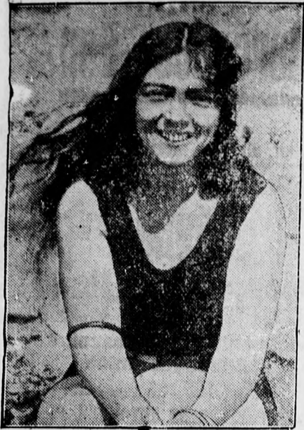
Miss Mercedes Gleitze, aki legutóbb 25 óra alatt uszta át a La Manche csatornát.

Földigénylők nagygyűlése. A földigénylők 1930. évi január 12-én délelőtt 10 órakor a színházteremben nagygyűlést tartanak. Ezen a gyűlésen megbeszélnek minden fontos ügyet, különösen a fizetési módokat, a vállalt kötelezettségek teljesítésének lehetőségeit. Kívánatos, hogy ezen a nagygyűlésen minden érdekelt megjelenjen, hogy egységes álláspont jöjjön létre.