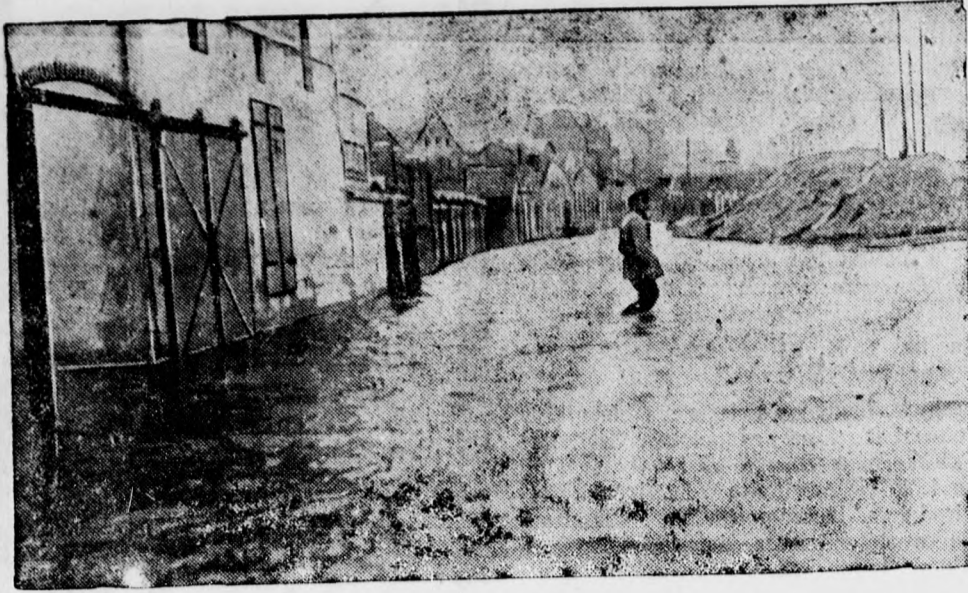
Árvíz Székelyhídon. A legutóbbi napok enyhe és szeles időjárása Székelyhídon hatalmas árvizet okozott. A kiáradt folyók elöntötték az uccákat.

— Mielőtt nyomtatványt rendel, kérjen árajánlatot az »Alföldi Ujság«-tól.