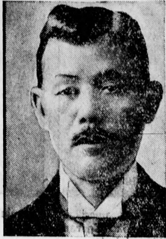
Tegnap délelőtt 11 órakor nyílt meg Londonban a flottaszervezési konferencia, amelynek megnyitását rá is Szentesen is sokan hallgatták. — A konferencia tagjai: Balszelen: Tardieu francia minisztereinek, középen: MacDonald angol minisztereinek, jobbszélen: Makatsuki, a japán delegáció vezetője.