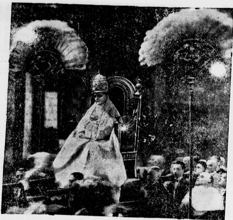
XI. Pius pápát koronázási évfordulóján a trónszéken visszaviszik a Vatikánba miséje után.