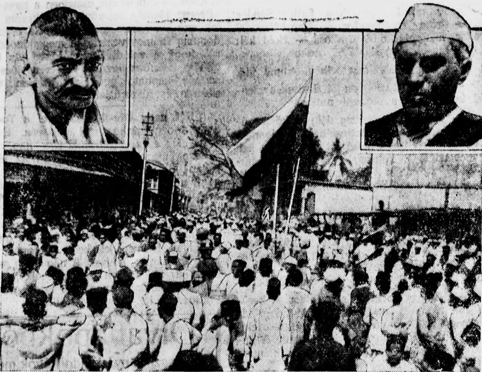
Gandhi (felső bal sarokban) vezetésével ezekre szaporodott az a tömeg, amely India felszabadítóit zarándokútján követi. Gandhi végrendeletében Patél-t (jobb sarokban) jelölte ki utódjának hível közül.