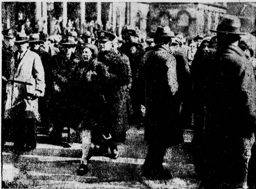
A megyorki »vörös csütörtök« elfogtak egy régóta keresett kommunista agitátort.

Hogy mi lesz a budapesti értekez- letnek kézzelfogható fontosabb ered- ménye, a közel napok hozzák meg a döntést. Remélhető, hogy a pénzügyi kormányzat megadja a megyei utépi- tés és a tiszai töltéserősítés nagyobb- arányu megindítására az anyagi lehe- tőségeket.