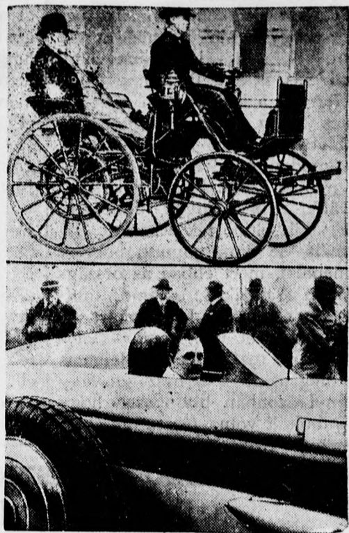
Kay Don angol gépkocsivezető világrekord-kísérletéhez: fent 40 évvel ezelőtti 2 lóerős első automobil, lent Kay Don a 4000 lóerős »Ezüst golyó« vezetői ülésében.

— A Bach-korszak szomorú, szenvedésteljes ideje alatt sem volt úgy meghunyászkodásra kényszerítve a magyar, mint ma. A Habsburgok alatt bátrabban küzdhetett a nép, akkor jobban kezében volt az önvédelem fegyvere, mint a mai időkben. A Habsburgok alatt is volt választási korrupció, de olyan eszközökkel, mint a mai rendszer, nem dolgoztak. 1848-ban, igaz, nem volt titkos választás, nem