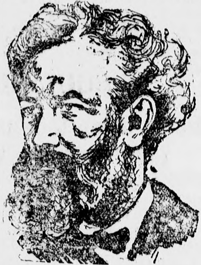
Március 24-én lesz negyedszázada, hogy Verne Gyula, a híres francia ifjúsági regényíró meghalt.

Az ismertetett tények következménye lett, hogy 1929-ben egyetlen szakmában sem emelkedett a kereseti lehetőség, sőt az minden vonalon visszaesett. Az érdeklépviseleti szervek útján megállapította a Kamara, hogy a kereskedelmi szakmában 1929-ben haszon általában nem volt és így átlagos netto haszonkulcsokat megnyugvással megállapítani nem is lehet. Miután azonban jól tudja a Kamara, hogy az államháztartást a súlyos gazdasági helyzet ellenére is adóbevételek nélkül fentartani lehetetlen, abban a reményben, hogy elviselhető lesz az adókövetés eredménye, számszerű becslés alapján megállapította a haszonkulcsokat és arról tájékoztatta az adókövető hatóságokat.