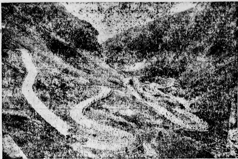
Százesztendő a Szent Gotthard ut, amely Észak- és Dél-Európa legfőbb összekötő útja

A Magyar Általános Takarékpénztár R. T. főkja értesíti t. részvényeseit, hogy az 1929. évi 4. számú osztalékszolvány folyó hó 18-tól kezdve 7.— pengőjével beváltható a Takarékpénztár pénztáránál.