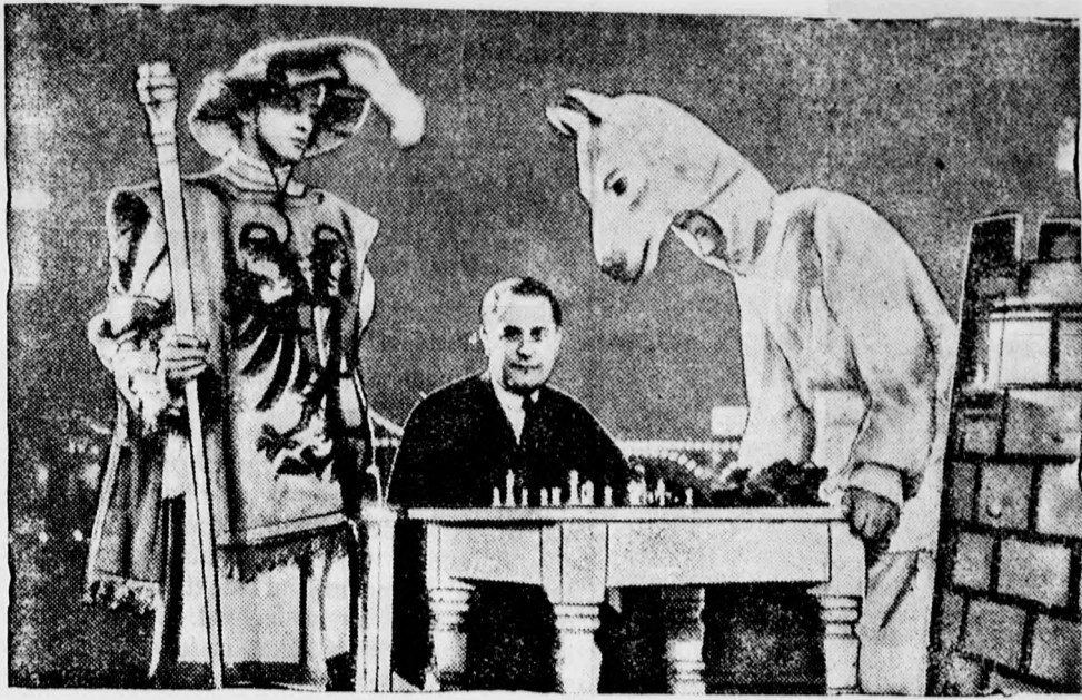
Capablanca világbajnok a berlini Lunaparkban érdekes sakkpartit játszott Elstner német mesterrel. Az óriási sakkmezőn jelmezes, élő alakok helyettesítették a sakkfigurákat.

Budapest, 550. Félvezette-... versenyre. 1. Sze- lauteur: Sze- intermezzo. 4. Schubert: An- 7. Bryan— 8. Dolz: Mihály: másik szereplő szmelyi Béla: Az egy... lyébe beállít... dákodó és... ruhára volna... járt késznek... tnyit elkész... anyagok, am... a: után megbe... a mértékvev... tékvevés meg... ról kezdtek... kódó azt mon... bbli folytatása. — De ha... s vizálsjelen- ni, majd csak... zetem majd... A szabón... nem akadály... gusztus 15-... szódia (New- Teltek-m... került a... már kiszab... kézen is van... előtt »ossz... c 1. szám; d) ról. Az inform... da negyon... fogja kifizet... téved, ha azt... fizet. Az inform... nem mindenn... Tegnap délel... ság büntügi... téf, majd kö... selővel, hogy... tesz a gazda... — Ha ó... meg akart ká... szabómester... mert az öltö... A rendőrs... a család csak... gazdálkodó... nem fizetne... gitott meggy... be foglalták... ni.« Vigjáték... tisztázni a... elkövethe... rendelt öltö... pedig tehet... a rendelője... megrendelt... információkat... kimenetele... Kísér: ge doch ge... Alma mia; 3. Schubert: und Leudvoll; Volin? 4. a) magyar nép- A megállap... egyesület... érem: érköz... díja 11 ezü... nyer el, am... sorsolás a... anennyiben... lezajlik az... sporttelepen... tizenegye... egyesület... Épület... egyéb... izléses mo... Sz... áron 2457