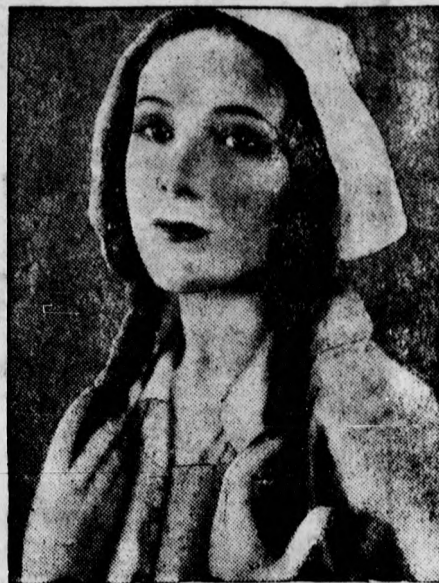
Dolores del Rio, a világhírű filmszínésznő, férjhez megy Gibbons amerikai rendezőhöz, aki a film számára felfedezte.

A döbbenetes vallomás után az apa bizonyosat akart tudni, ezért elvitte a kislányt az egyik orvoshoz, akút megkért arra, hogy vizsgálja meg. Az orvosi vizsgálat megerősítette az apa gyanuját és a kislány vallomá-