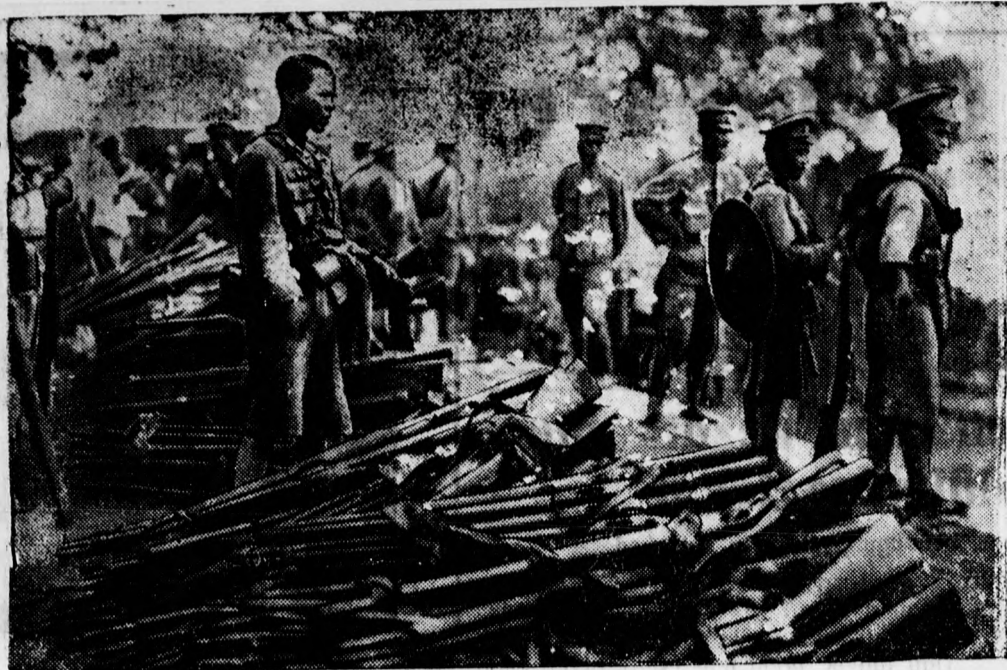
A Középkínai kommunista harcokhoz: kommunistáktól elszedett fegyverek Hankauban.