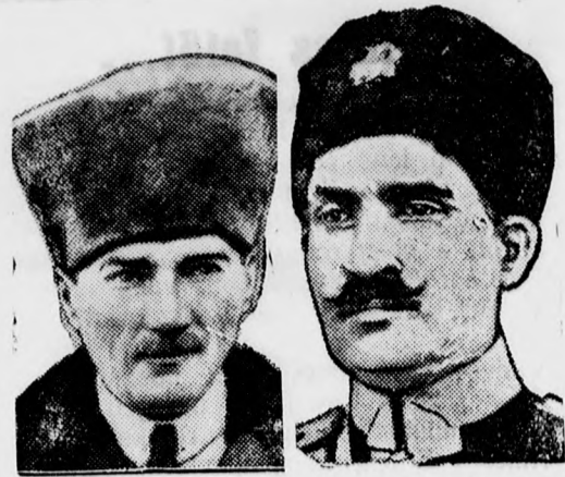
Kemál pasa, a török köztársaság elnöke és Khan perzsa sah egyesültek a lázadó kurd törzsek leverésére.

A szegény szívet, mely ő vele van tele. Az ifjut a leány ellenkezése csaknem