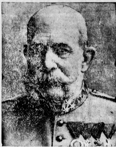
Augusztus 18-án lesz száz éve, hogy I. Fe- renc József megszületett.

***) Bottyánról azt tartotta a nép, hogy csoda-lova van, maga halált nem ismer.