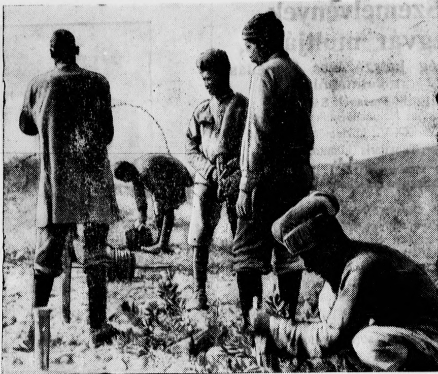
Az angolok szigorú büntetőexpedíciót szerveztek az indiai afrikák fellázadt néptörsze ellen. Az afrikák azonban ellentámadásba mentek át és az angol csapatok helyzete nagyon komoly.