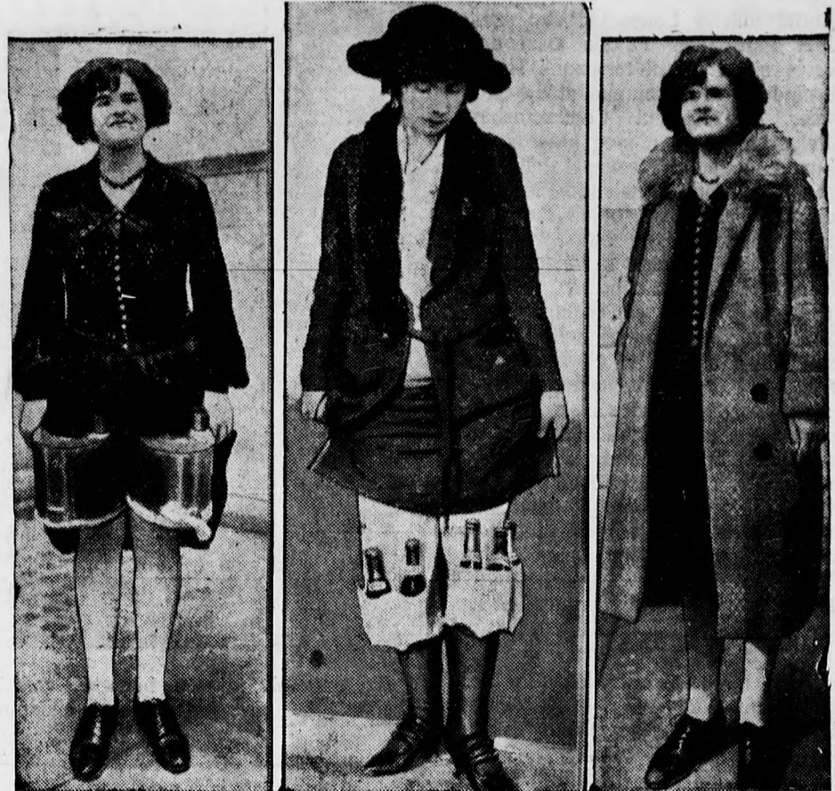
Mindig eredetibb trükköket találnak ki az alkohol csempészésére a »száraz« Amerikában. Legujabban a női alsóruhákba rejtik a butykosokat.

Befejezésül hadd szóljon itt az alábbi »Alku Levél«, mely az előbbeni excessusoknak és hosszantartó ádáz viszálykodásoknak