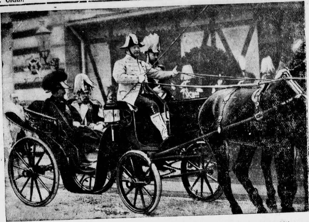
Ferenc József születésének századik évfordulójához: amikor 20 évvel ezelőtt Vilmos császárt fogadta Bécsben.

semmiféle terhelő adatot nem tudott szerezni a kisleány vallomásán kívül a megnevezett férfi ellen. A gyanúba vett férfi elmondta, hogy nagyon jól ismeri az apát, ismeri a kisleányt is, volt ugyan kint a tanyán, de soha nem közeledett bűnös szándékkal a kisleányhoz, ő maga döbbsen meg legjobban, amikor meghallotta, hogy a gyermekleány anyai