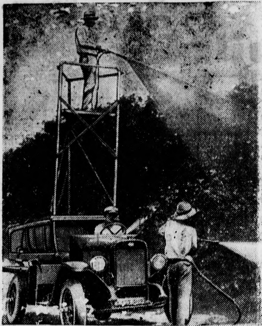
Igy öntözik most Amerikában az óriási szárazságtól szenvedő kertészeteket.