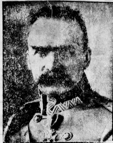
Pilsudsky tábornagy, az új lengyel kormány-elnök, aki vissza akarja állítani a katonai diktatúrát.

elnyert vállalkozókkal a szerződéseket is megkötötték s azokat a legközelebbi th. bizottsági közgyűlés elé terjesztik. Az építési munkálatok a kedvező időjárás mellett zavartalanul folynak és gyors előrehaladásuk mellett minden kilátás meg van arra, hogy a tervbevetett utak még ez év novemberében rendeltetésüknek átadhatók lesznek.