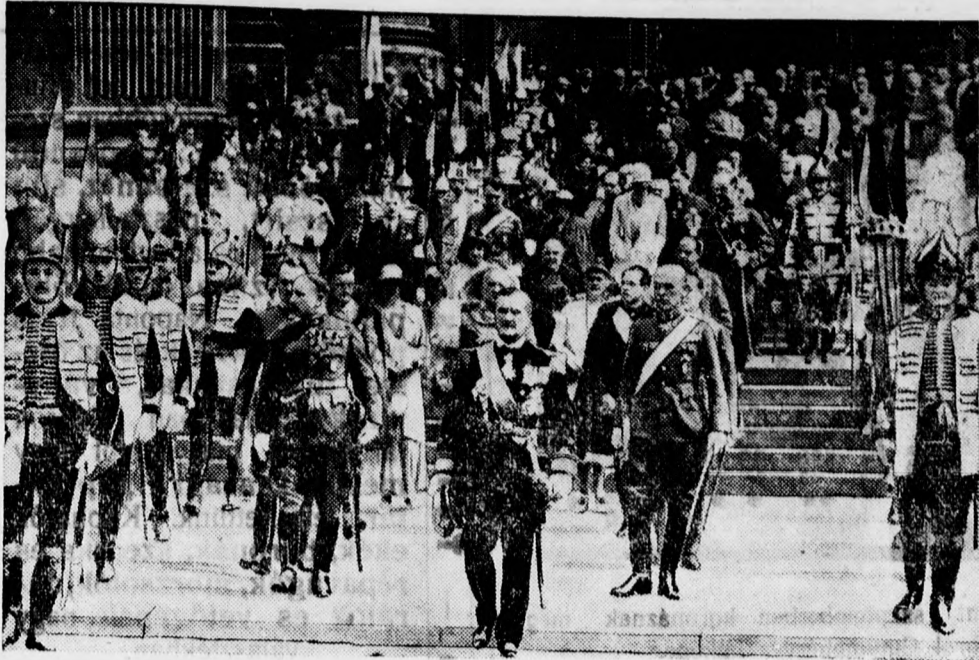
Felvétel a budapesti Szent István napról. A Szent Jobb körmenet elindul a Bazilikából. A testőrök festői sorfala között az élen halad Horthy Miklós kormányzó, mögötte a harmadik sorban József Ferenc, József és Albrecht főhercegek, mögöttük a kormány, a felsőház és a képviselőház tagjai.