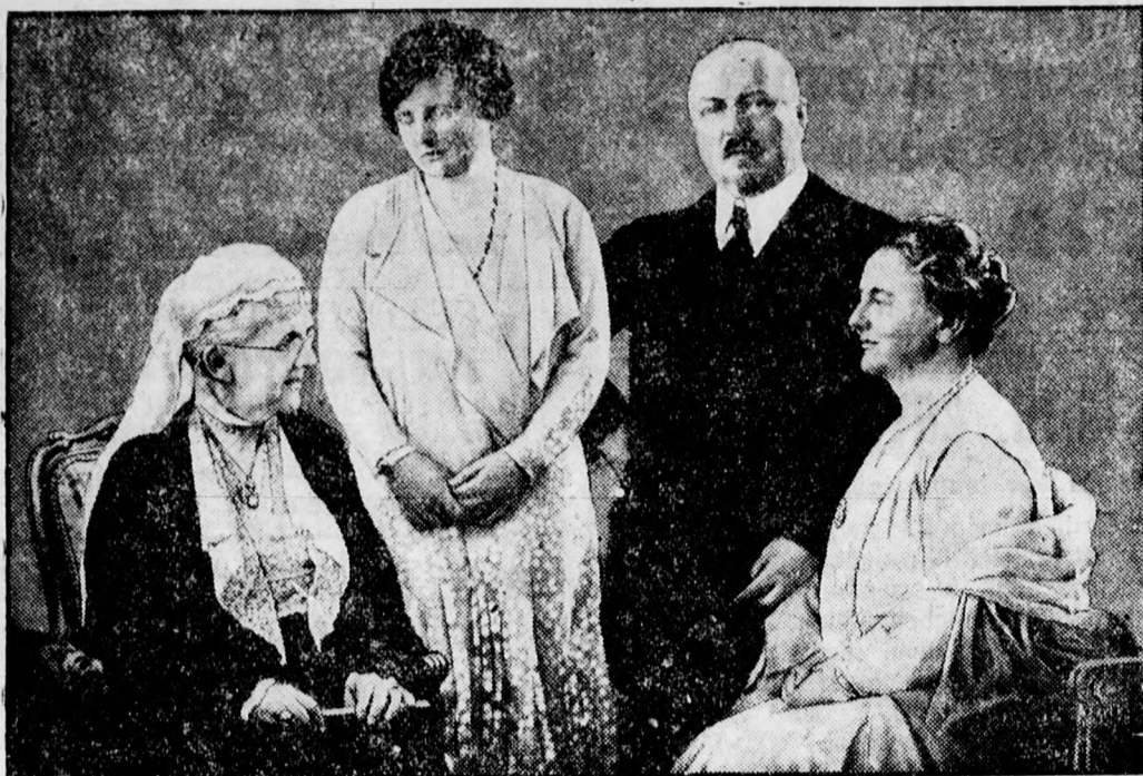
Vilma hollandi királynő 50 éves, ebből az alkalomból készült a fenti csoportkép a királyi családról. Ülnek Emma hercegasszony, a királynő anyja, Vilma királynő, Juliana trónörökös és Heinrich herceg.

lyettes jelentéséből kitűnt, hogy a julius végén mutatkozó adóhátralék 1,264,470 pengő 94 fillér volt a megyében. Ez a folyó évi előírás 63.15 százaléka.