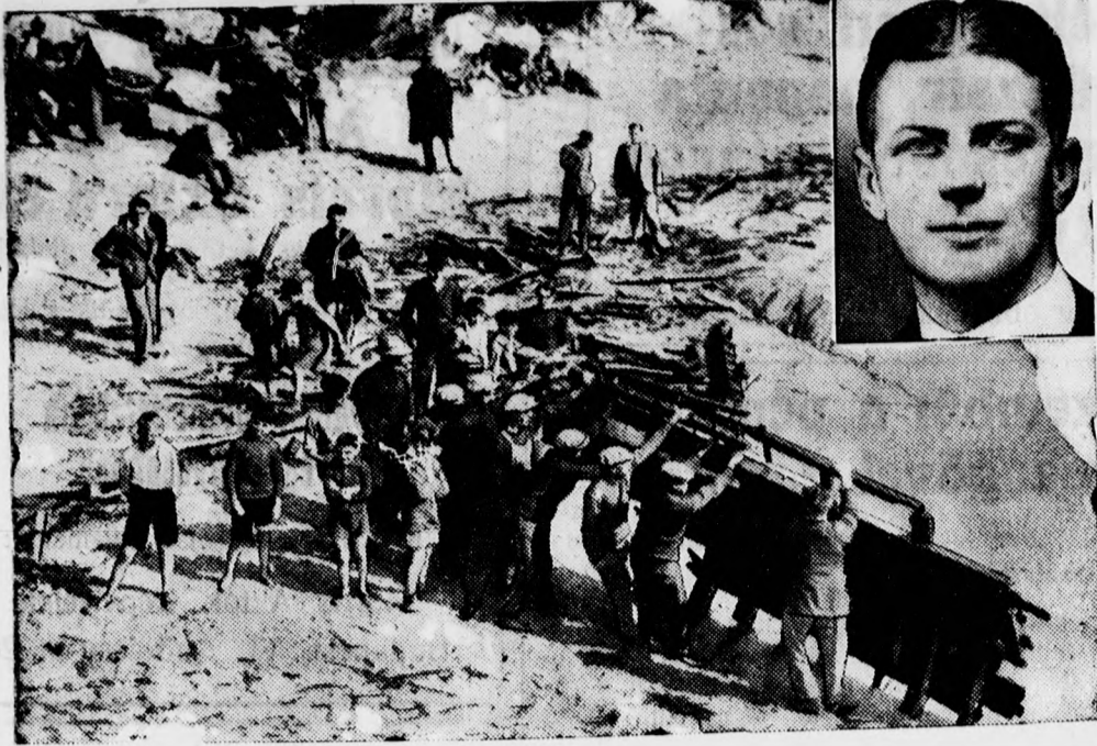
King volt angol bányáügyi minisztert halálos szerencsétlenség érte: az »Islander« nevű motorshajója zátonyra futott és elsüllyedt, a miniszter a tengerbe fulladt. Fent: King arcképe, lent: a hajó roncsait kifogják a tengerből.