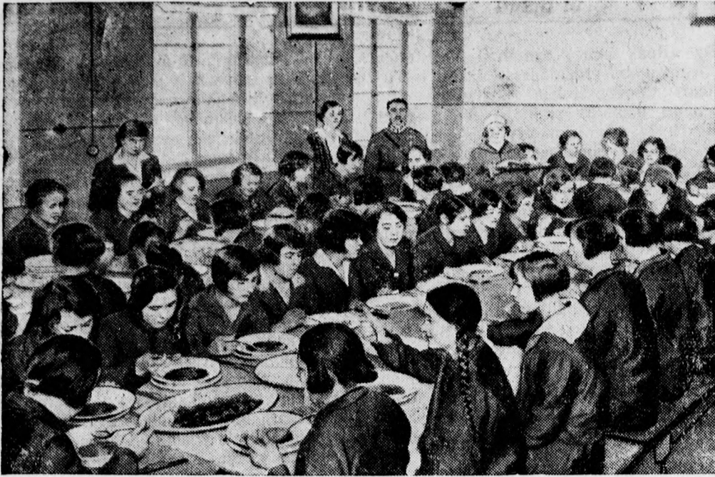
Lengyelországban felállították a női rendőrséget. Képünk a varsói női rendőrök ebédjéről készült.

— Az Osztályorsjáték tegnapi huzásán a következő nagyobb nyereményeket sorsolták ki: 50,000 pengőt nyert: 73754; 5000 pengőt nyert: 5886; 3000 pengőt nyertek: 47302, 50193, 70627; 2000 pengőt nyertek: 61577, 67204, 68387, 71182, 80490; 1000 pengőt nyertek: 2492, 5811, 28711, 81312; 800 pengőt nyertek: 26783, 41274, 41527, 66994, 74603, 82180; 600 pengőt nyertek: 18197, 36316, 40878, 41604, 43200, 60215, 69020, 70508, 77929, 83074; 500 pengőt nyertek: 2873, 9655, 16898, 23114, 44831, 46989, 55080, 71222, 72246, 74853. — Ezenkívül kihuztak még 400 pengős, 300 pengős és 150 pengős nyereményeket. A huzás folytatása ma tovább tart.