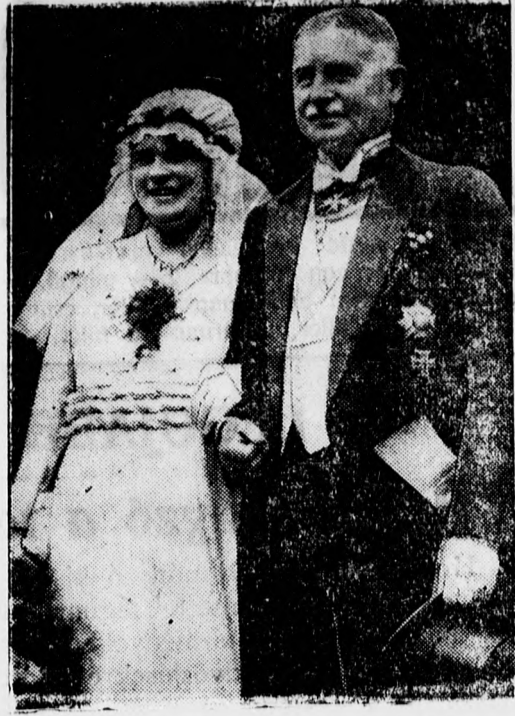
Groener német honvédelmi miniszter meg-nősült.

lenőrzés alatt fog állni, közvetlenül a gazdasági tanácsnok alá van rendelve a tűzoltólegénység. Nagyobb ügyekben pedig a polgármester fog intézkedni. Ez a tűzoltói szolgálatban a fegyelmi rész, a gyakorlati dolgok intézése egyelőre a tűzoltóörmszterre hárul. Emellett a megoldás mellett szó van arról, hogy az önkéntes tűzoltóknak, különösen a tisztai rangban lévőknek tágabb működési terük lesz és az önkéntes tűzoltóság és a hivatásos tűzoltók között harmonikusabb együttműködést kívánnak megteremteni.