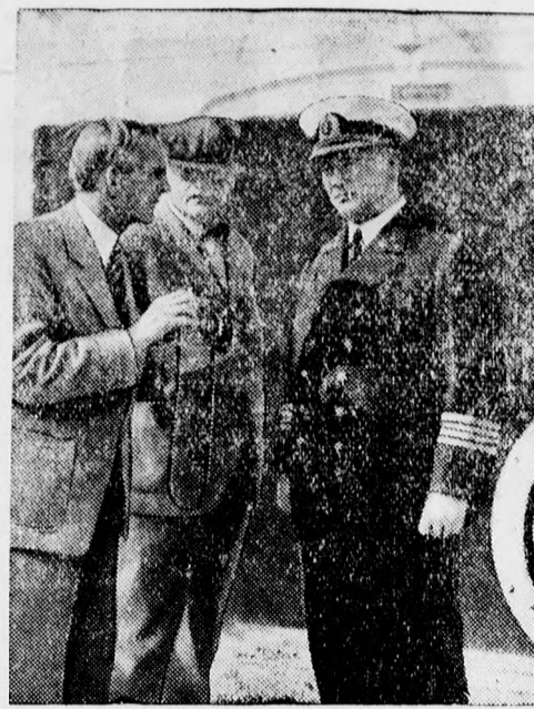
Ford autókirály Európába érkezett.