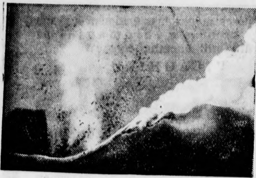
Stromboli tűzhányóhegy tizenegy éves szünetelés után újból kitört.