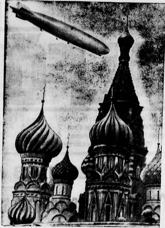
A »Graf Zeppelin« Moszkva felett.