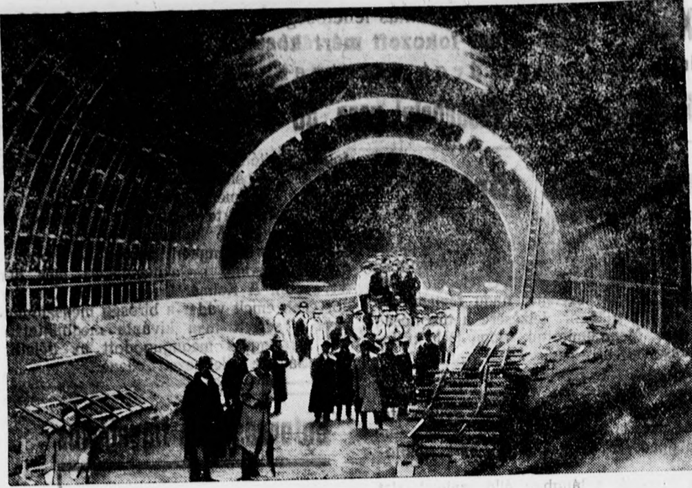
Liverpool és Birkenhead között építik a világ legnagyobb vizalatti alagútját. Az alagutkolosszus 3 és fél kilométer hosszú lesz.