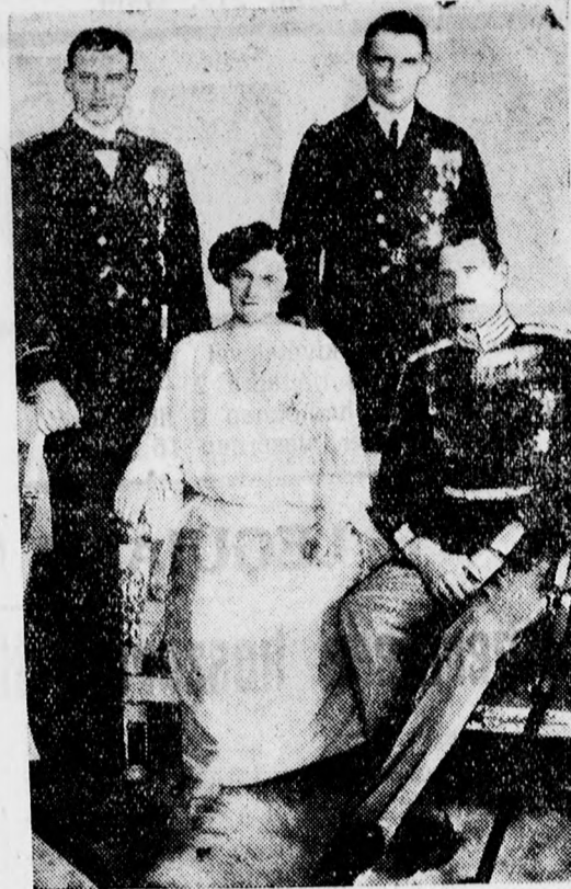
Szük családi körben ünnepli hatvanadik születésnapját Christian dán király.

Tegnap reggel megkezdtek a kirakodóvásár felállítását is, vidékről ismét igen sok