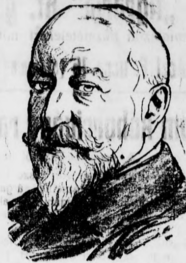
Ferdinánd volt bolgár király, aki éveken keresztül élt száműzetésben, visszatér hazájába. A bolgár király a háború előtt gyakran járt Magyarországon és különös élvezettel tartózkodott a felvidéken.

A negyven százalékkal olcsóbb színházjegyek váltására feljogositó szelvényeket hétfőn délelőtt fél 12 órától lehet beváltani a színházi pénztárnál.