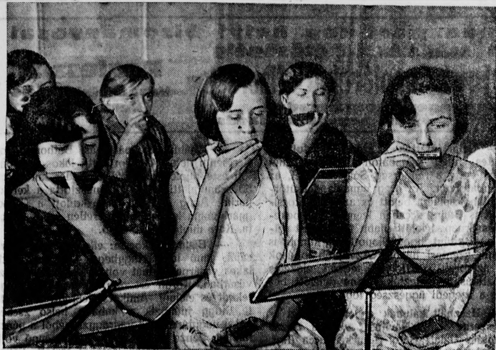
A legfuresőbb zenekar Berlinben van: a zene kar tagjai valamennyien szájharmónikát fujnak