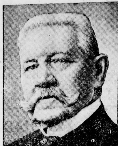
Hindenburg német köztársasági elnök október másodikán lesz 82 éves.

Felelősség folytán az alispánhoz került másodfokon az ügy, amely az alispán előtt váratlan fordulatot vett. Beszerezték a tanuvallomásban megjelölt könyvet, arról kiderült, hogy nem cselédkönyv, hanem munkásigazolvány és a bére vonatkozólag semmiféle bejegyzés sincs benne. Az alispán átvizsgálta az ügyet és úgy határozott, hogy nem 930, hanem 555 pengő jár Vecseri Lajosnak, ezt az összeget meg is ítélte. Ebben közölte az elsőfoku bírósággal, hogy az ügy jogerősen véget ér, hivatalból indítsák meg Papp István tanu ellen hamis tanuzás miatt a bűnvádi eljárást.