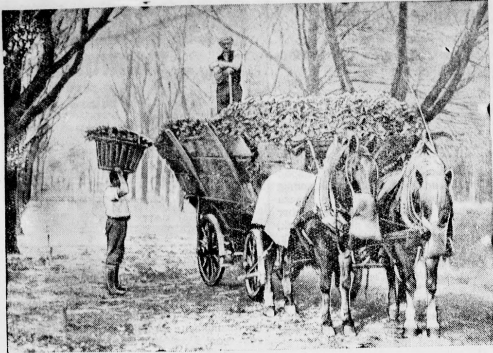
Itt az ősz, jön a tél. A parkokban kocsiszá mra szedik össze a fákról lehullott leveleket.

szól. Azok is azt hitték, hogy most bekövetkezett az utolsó órájuk. Látszott, amint elhaladtak egy fevessontváz mellett, mely az utszélen hevert. Látni lehetett a tekintetükön, amint utána néztek egy pár arra repülő keselyűnek. Nem is történelmi másképp. El kell pusztulniok.