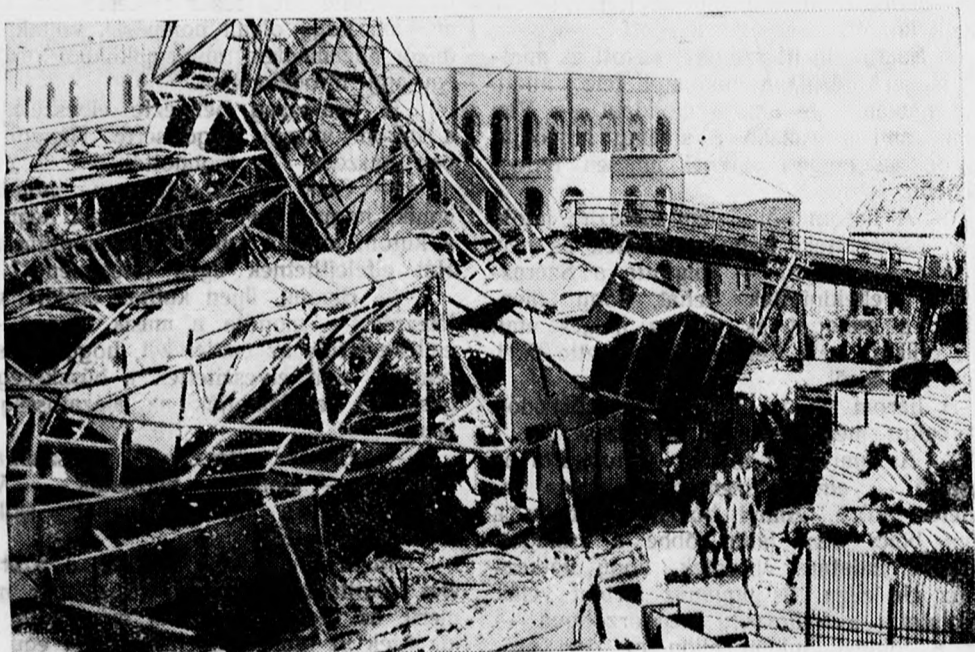
Ez alatt a romok alatt még több holttest fekszik.