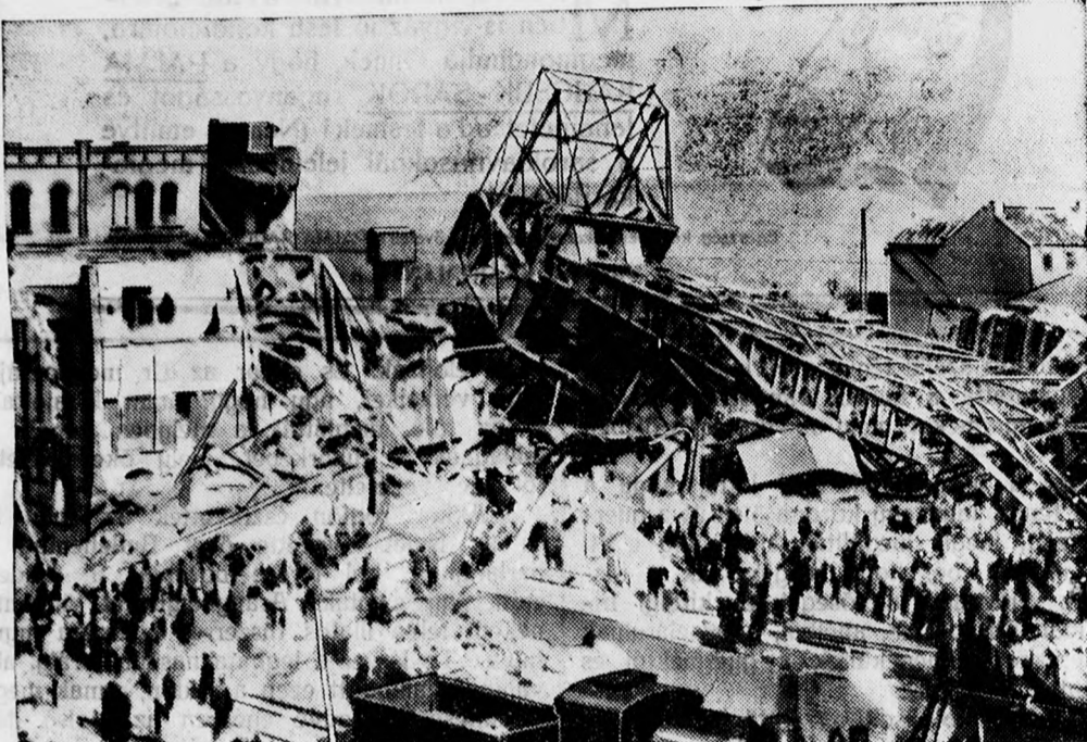
Az alsdorfi bányatelepek képe a robbanás után. Bedől a hatalmas bányaeépület is.

A németországi Alsdorfbán, a bányavidék e forgalmas városában van az a bánya, amely eddig még meg nem magyarázott módon borzalmas robbanás színhelye volt. Mintegy háromszázfőnyi bányászcsapat volt a hét elején lent az Anna-bányában, melyet egyszerre csak irtózatos detonáció reszketett meg. A robbanás ereje olyan nagy volt, hogy