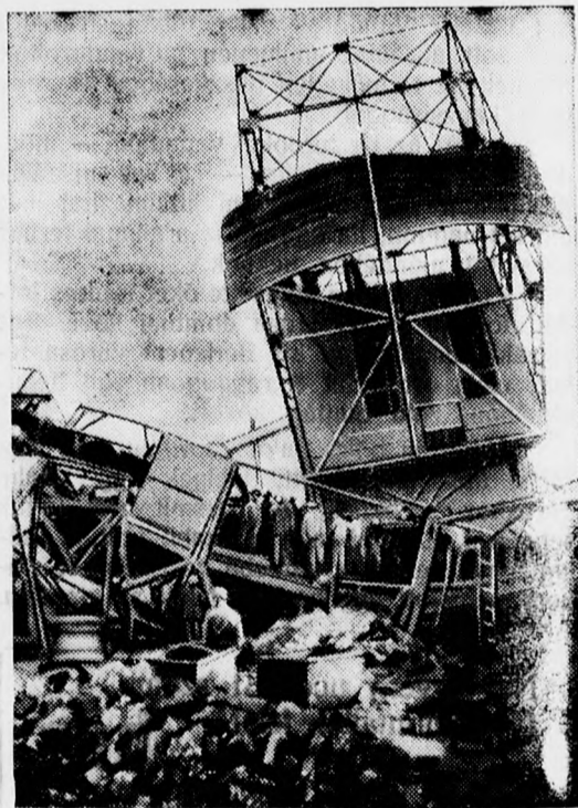
Pozdorjává tört a 85 méter magas felvonótorny.

a halottak száma elérte a kétszázhatvanat.