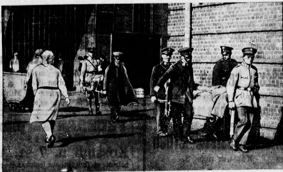
Szanitézkatonák hozzák a bányából kimentett holttesteket.

beomlott a néhány nappal ezelőtt kiásított tárná, a bányászok nagy csoportját ték, de beomlott a lejárati fölé emelt hálók, de beomlott a lejárati fölé emelt hatalmas bányaeépület is, amely 56 embert temetett el.