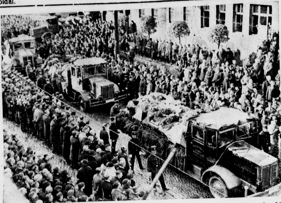
Ezrek és ezrek sorfala között temették el szombaton az alsordfi bányakatasztrófa 266 halottját. A koporsókat szállító teherautókat bányászok kísérik.