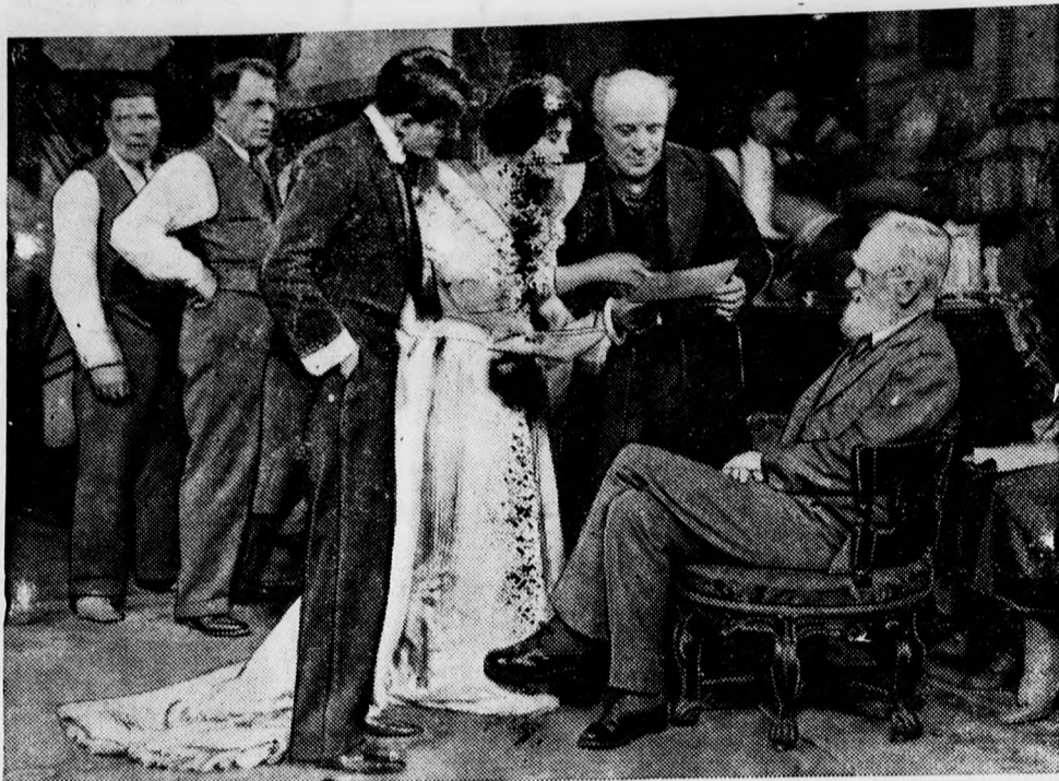
Bernard Shaw, a világhírű angol író és költő hosszas rábeszélés után megengedte, hogy egyik darabjából hangosfilmet készítsenek. Shaw — az ülő alak — személyesen irányítja a hangosfilm rendezését.