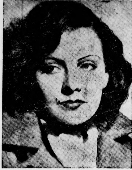
Greta Garbo, a világhírű filmszínésznő most készül tei első hangosfilmjével.

Auto, Traktor, Motorkerékpár és mindennemű más gépek javítását végtezzesse a MOTORSZANATORIUMBAN Bálint ucca 1.