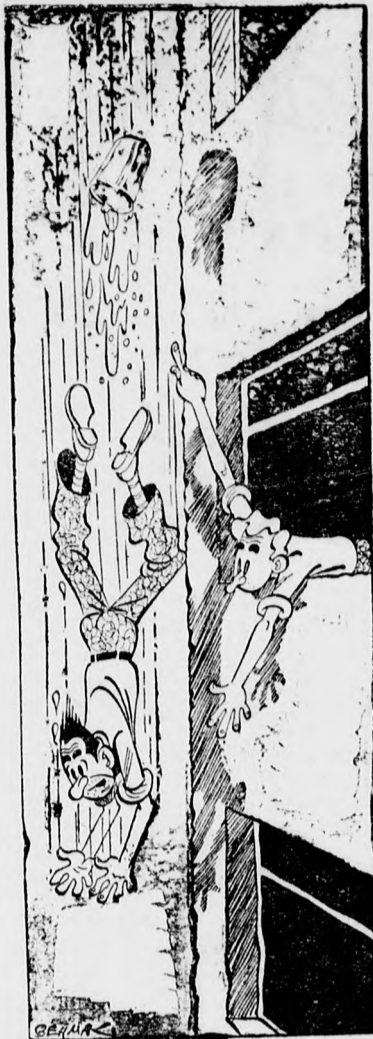
Amerikai humor: Munkaközvetítő a lezuhanó munkáshoz: Megállj, ügyetlen, levonom a fizetésedből a kiömlött malter árát!