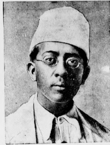
Davi Das Gandhi — Gandhi, a világhírű hindu vezér fia — hathavi fogság után éhségsztrájkot kezdett a Bombay-i angol börtönben és éhenpusztult.