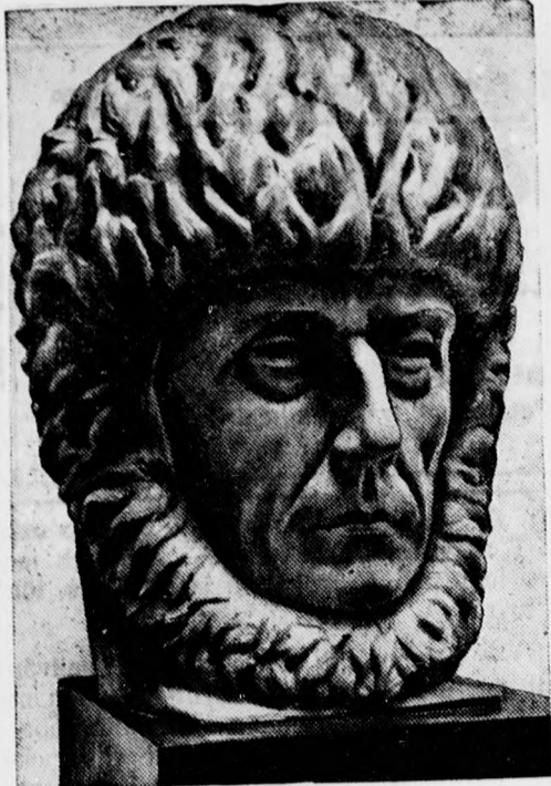
Amundsen, a nyomtalanul eltűnt világhírű sarkutazó szobra, amelyet az Északi Sarkon helyez el egy expedíció.

— Kiselejtezik a régi elavult értékeket. Felsőbb rendeltre kiselejtezik a városi számvétségél fekvő régi elavult értékeket. Van nek köztük korona-értékre szóló régi takarékpénztári betétkönyvek, amelyek ovadékként szolgáltak. Előkerült több hamis lebélyegzésű háborúelötti és azután még kiséideig érvényben volt 20 és 100 koronás bankjegy, amelyek annakidején a város pénzkészlete közé keveredtek. Találtak még más egyéb értéktelenedett értékpapírt is. Most valamennyi értéket pengőre átszámítva kiadásba helyezik, további nyilvántartásukat megszüntetik és ha lehet, természetben kiadják jogos tulajdonosaiknak.