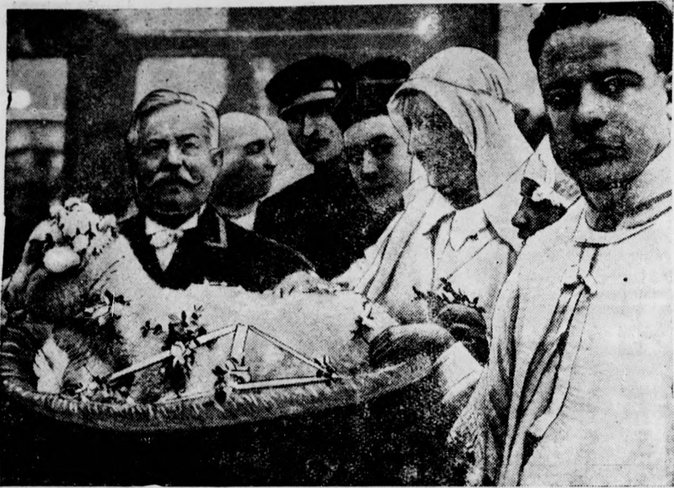
Agnes napján — január 21-én — régi szokás szerint felpántlikázott kisbárányt küldtek ajándékba a római pápának.