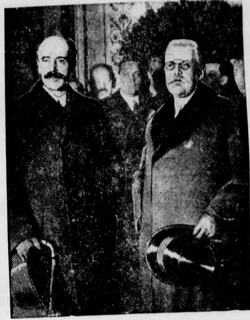
Bethlen István gróf miniszterelnök elutazása előtt a bécsi pályaudvaron, ahol az osztrák kormány nevében Schober külügyminiszter bucsuzott el tőle.

Már a hajnali órákban feltűnt a vásárt ellenőrző rendőröközgeknek, hogy feltűnően nagy számban özönlöttek el az állatvásárt a cigány alkuszok. Nem azok, akik hivattasszerűen végzik a jószágok közvetítését, hanem azok, akik kiszemelik a pénzzel rendelkező gazdákat és ráveszik arra, hogy olyan jószágokat vásároljanak meg, amelyek rendszerint kimustráltak, valami rejtett hibájuk, betegségük van. A cigány alkuszok csapata valóságos etaraszta a vásárt, néhány vételbe beleavatkozott, anélkül, hogy erre az eladó, vagy a vevő kérte volna őket. A hivatalan közbelépés miatt néhol veszekedésre került a sor, mire a rendőrség részéről intézkedés történt, hogy szedjék össze az alkalmatlanok cigányokat. Rendőrök és detektívek emelték ki a vásárt sokadalom-