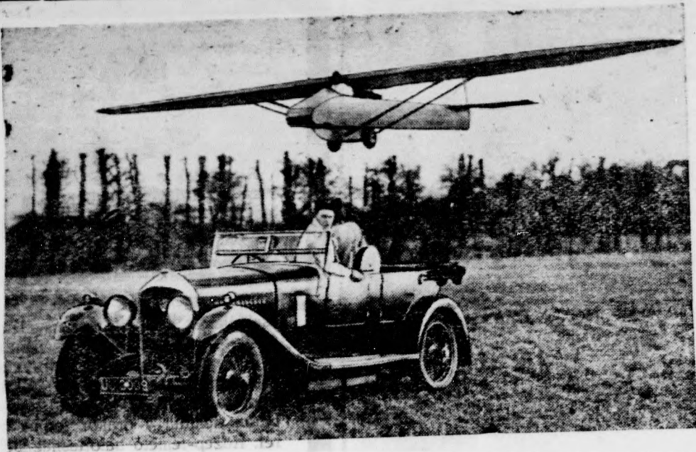
Ma már sik terepen is fel tudják engedni a motornélküli repülőgépet. Autó után kötik, amely rohanásával — mint a sárkányterest, gyermek a futásával — magasba segíti.