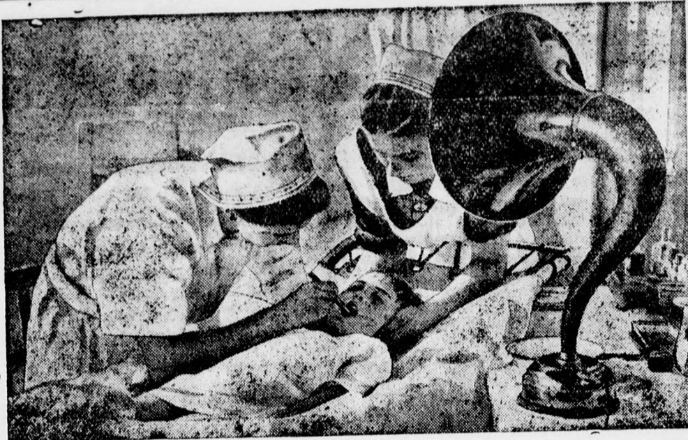
A berlini vöröskereszt kórházban a beteg gyermekeket rádió mellett kezelik. A hangszóróból kiáradó ének, vagy zene nagy mértékben elvonja a gyermekek figyelmét, így a kezelés sokkal könnyebben elvégezhető.