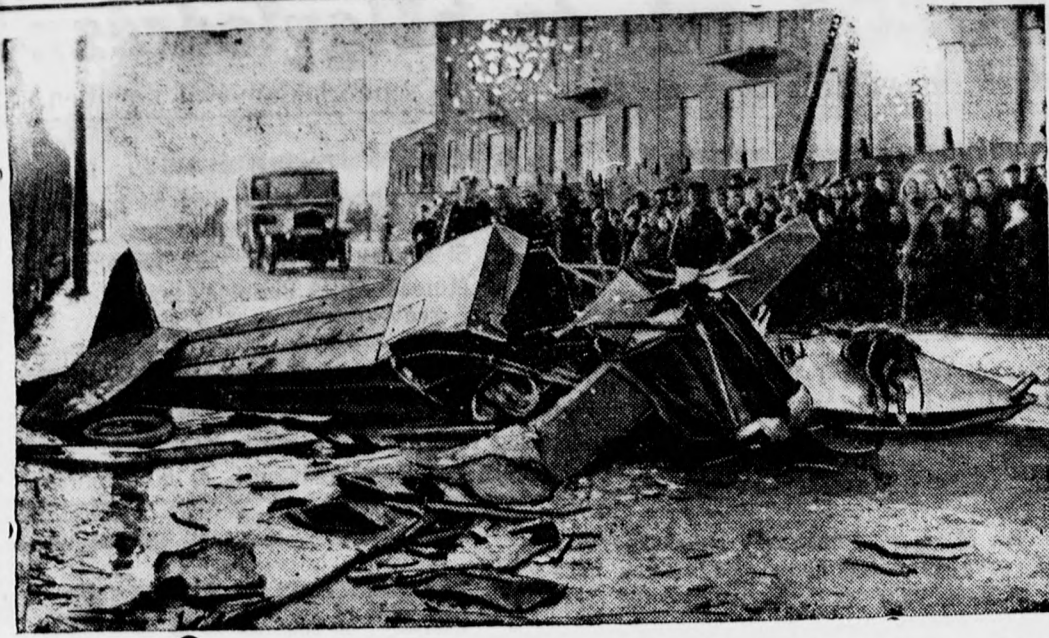
Repülőkatasztrófa világszerte: Egy gyakorlatozó lengyel katonai repülőgép leesett Varsó egyik főuccáján. A kaatasztrófa a pilóta és a mechanikus életébe került. A megfigyelőtiszt életveszélyesen megsebesült.