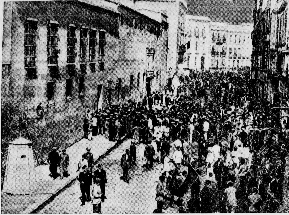
A spanyol köztársaság kikiáltásakor a tömeg megrohanja sevillei börtönt és kiszabadítja a fogságban levő forradalmárokat.