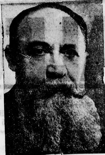
Jorga professzor, az új román kormány elnöke

roznak, hogy az adóhajtót és becsüst ideiglenesen alkalmazzák a végrehajtási költségek-ből várható többletbevétel terhére.