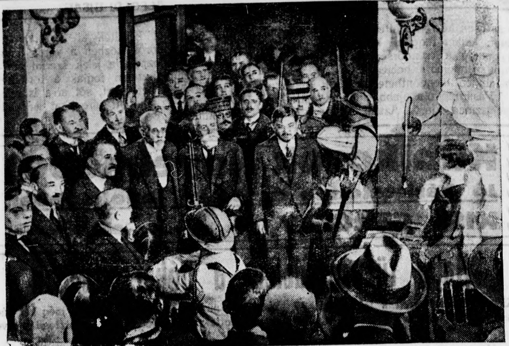
Első felvétel a francia elnökválasztásról: Doumer, az új elnök (x) a választás után. Mellette jobbról Laval miniszterelnök.

Bucvány szabóüzemét Kisér ucca 2 szám alá áthelyezte.