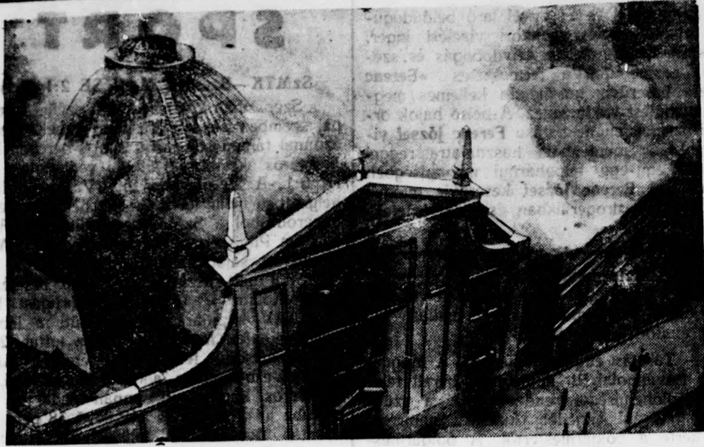
A madridi zavargásokból: Ég a jezsuiták madridi kolostora.