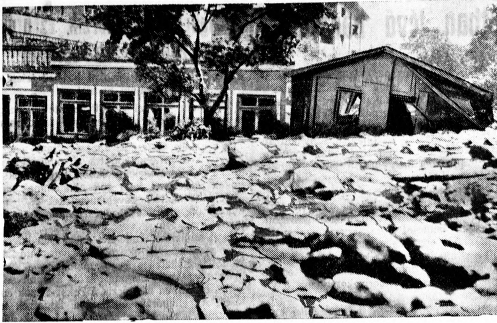
Koprun, a kis hegyi falu, Zell am See mellett, az iszaplavina pusztítása után.