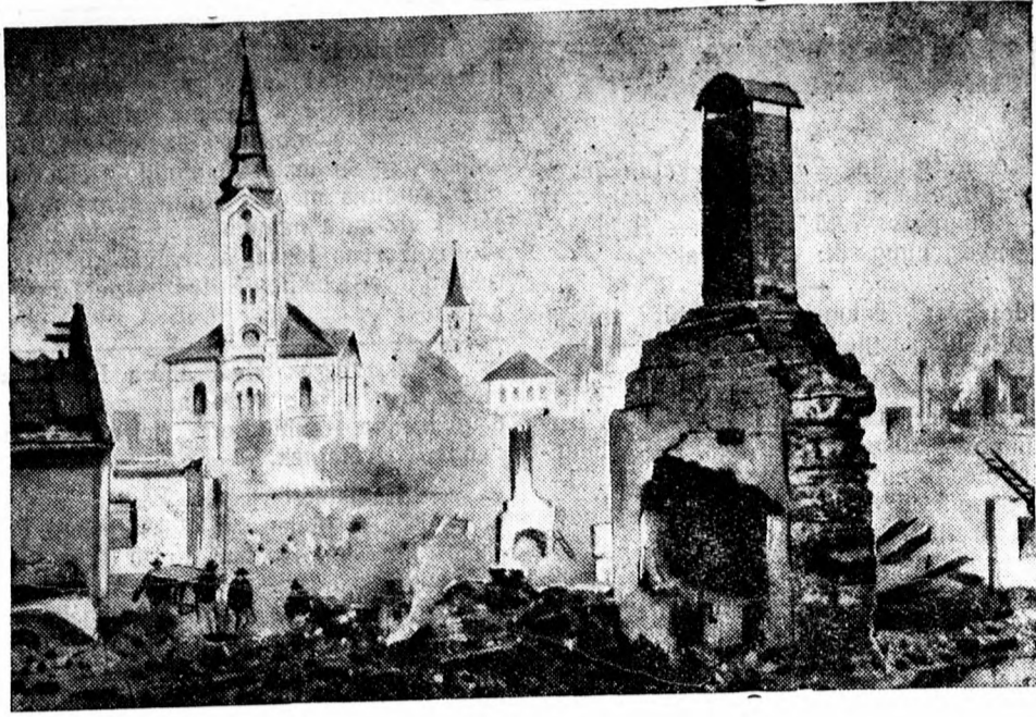
Óriási tüzvész pusztított a megszállt Késmárk melletti Vazecs faluban, amelynek során hat ember a lángokban veszett oda, 3400 lakos pedig hajléktalan lett.

— A cukorrépa, köles, mohar, ha esőt kapnának, adhatnának föltermést. A legelőket lesültek, míg más esztendőben szeptember végéig kint lehetett a jószág, az idén már a múlt héten — például a terehalmi legelőről — haza kellett hajtani a jószágokat, amelyeket jászolhoz kötve takarmányoznak.