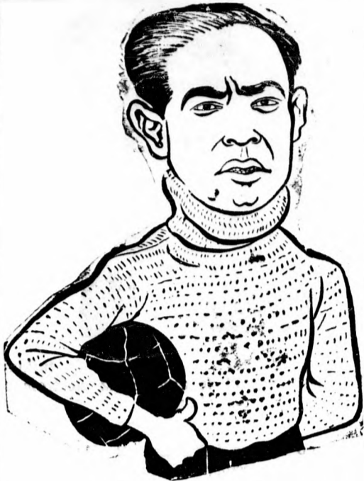
Ricardo Zamora, a világhírű spanyol kapus, akinek tudománya csodót mondott a múltvasárnapi spanyol-magyar meccsen.

Az eredmény megfelel az erőviszonyoknak, bár a bírónak a tizenegyest meg kellett volna adnia. A SzTE csapata az első féldőben tulságosan értékelte ellenfelének nagy