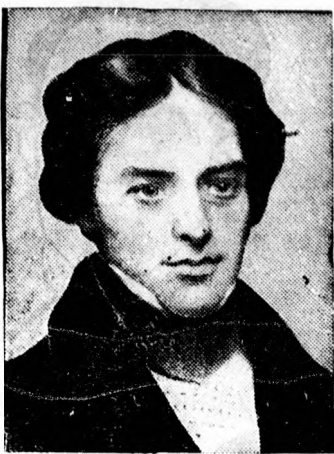
Faraday, a híres angol kémikus és fizikus 100 évvel ezelőtt fedezte fel az elektromos indukciót.