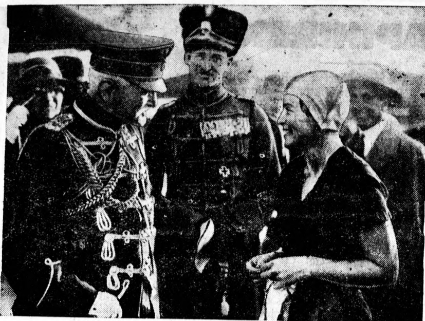
Mackensen tábornok, a világháború német hőse üdvözlöi Elli Beinhorn kisasszonyt, a híres német pilótanőt a köningsbergi repülőtéren.

Nyomatott az »Alföldi Ujság« köznyomdája és lapkiadó vállalat nyomdájában Szentésen.