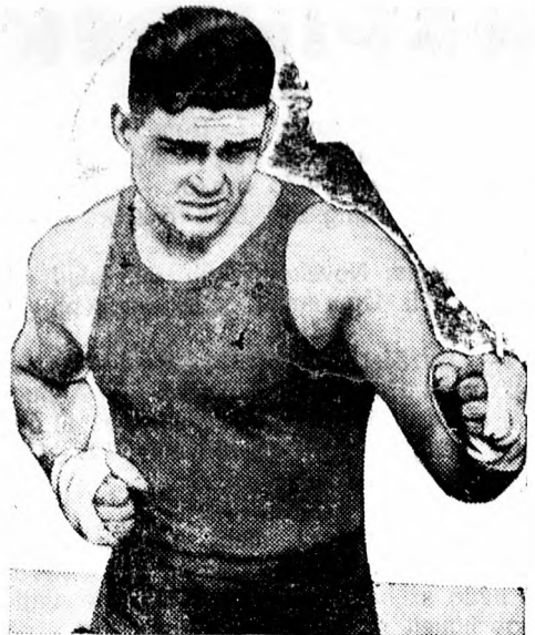
Jack Dempsey, a nehézsúlyú boksizolás volt világbajnoka a büszke és vagyontelendő világbajnoki címért meg akar verkedni Schmeling-gel.