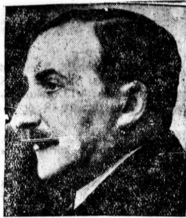
Stefan Zweig, a világhírű író 50 éves.

Pénzkölcsönök a legelőnyösebben közvetít Toffler László pénzkölcsönkövetítő (Báró Harucker u. 8.)