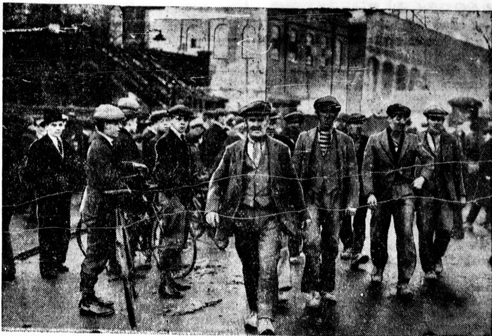
Az angliai Bentley-Grube vidéken lévő szénbányában bányalégrobbanás történt, amely negyvenhét bányászt megölt. A kép a katasztrófából élve menekült bányászokról készült