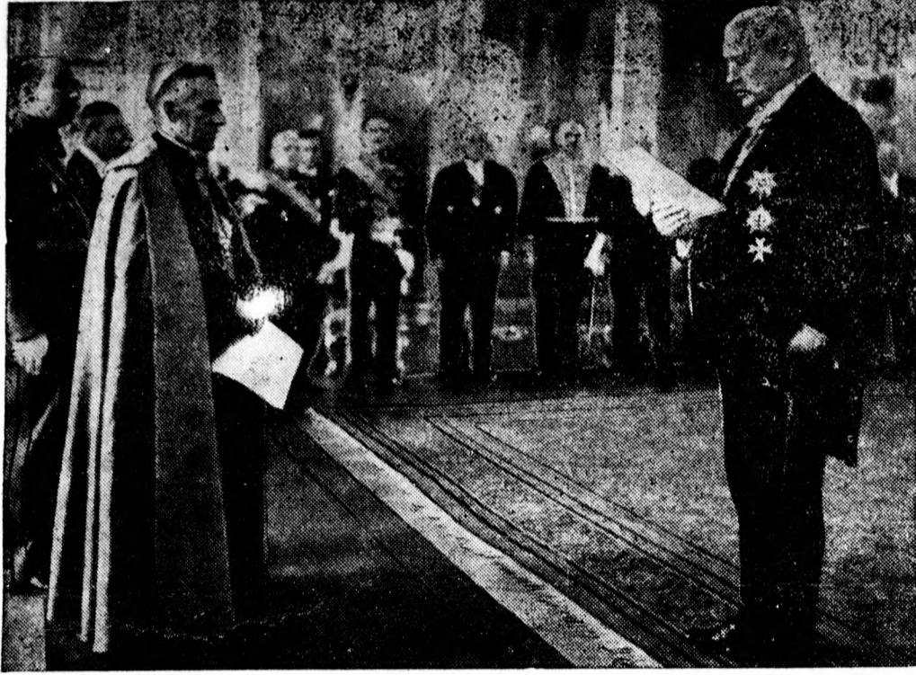
Ujévi fogadtatás Hindenburg német köztársasági elnökénél.