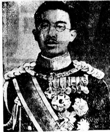
Hirohito japán császár ellen merényletet követtek el.

A munka ezenkívül azért is folyik lassan, mivel az inségmunkások közül többen nem jelennek meg. Így tegnap is mindössze hetvenen dolgoztak a gátmunkálatoknál. Sok szükségmunkás még egyáltalán nem is jelentkezett munkára, pedig már december végére megkapta hívócéduláját. Ilyen körülmények között természetesen nagyon megnezzül a mérnöki hivatal programjának keresztülvitele. Tegnapi ugyan újabb 100 embert vettek fel inségmunkára, de akkor, amikor a gátmunkálatoknál 150—160 embernek kellene naponta dolgoznia, a tényleg munkába állók száma aig éri el ennek egyharmadát, ilyen körülmények között a befejezésnek időpontja bizonytalan.