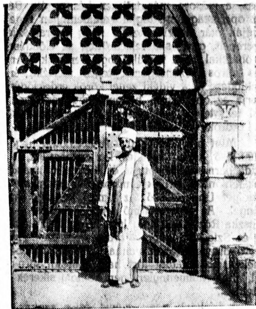
Gandhit ebben a börtönben őrzik Indiában. A börtön kapuja elég erős ahhoz, hogy a mahatmát ne tudják kiszabadítani hívei. Gandhival együtt 120 nacionalista vezetőt letartóztattak már.

3 szoba, 2 konyha, 2 kamra, istálló, kocsiszin, ól, egész nagy porta, ártyúzikuttal 2500 pengőért sürgősen eladó. Értekezni: Széchenyi-ucca 57.