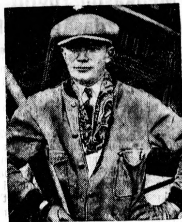
Jackson a tragikus halált halt amerikai repülő.

A vizsgálat befejező részét most Budapesten folytatják. A vidéken összeszedett adatokat összehasonlítják a valutabefizetési tételekkel annak a megállapítására, hogy a valutakihágás ténye fennforog-e, avagy sem.