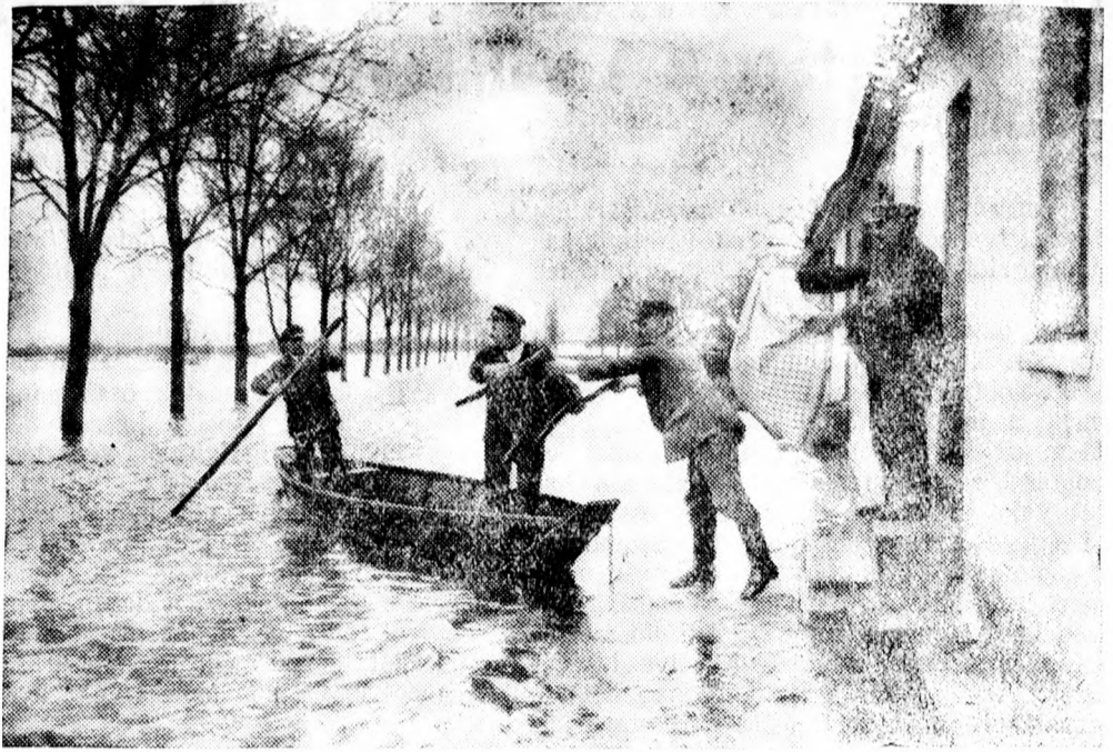
A németországi árvizektől legtöbbet Dessau városa szenvedett. Képünk: csónakon szállítják el egyik ház berendezését.