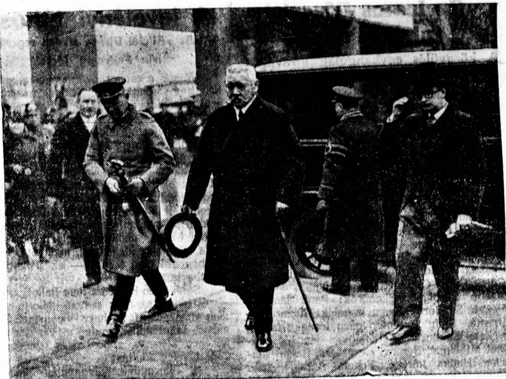
Hindenburg német birodalmi elnök, akivel szemben most Hitler akar fellépni a közelgő elnökválasztáson.