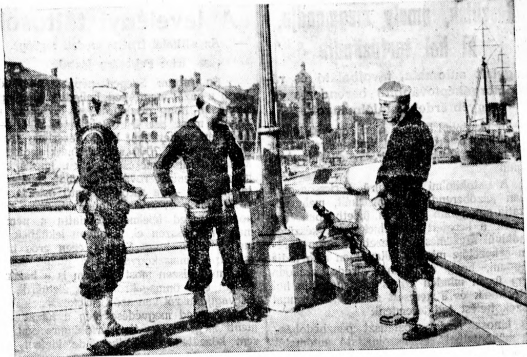
Amerikai matrózok állanak őrt Sanghaiban az idegen negyedben, hogy őrizzék a fehér emberek életét és vagyonbiztonságát.