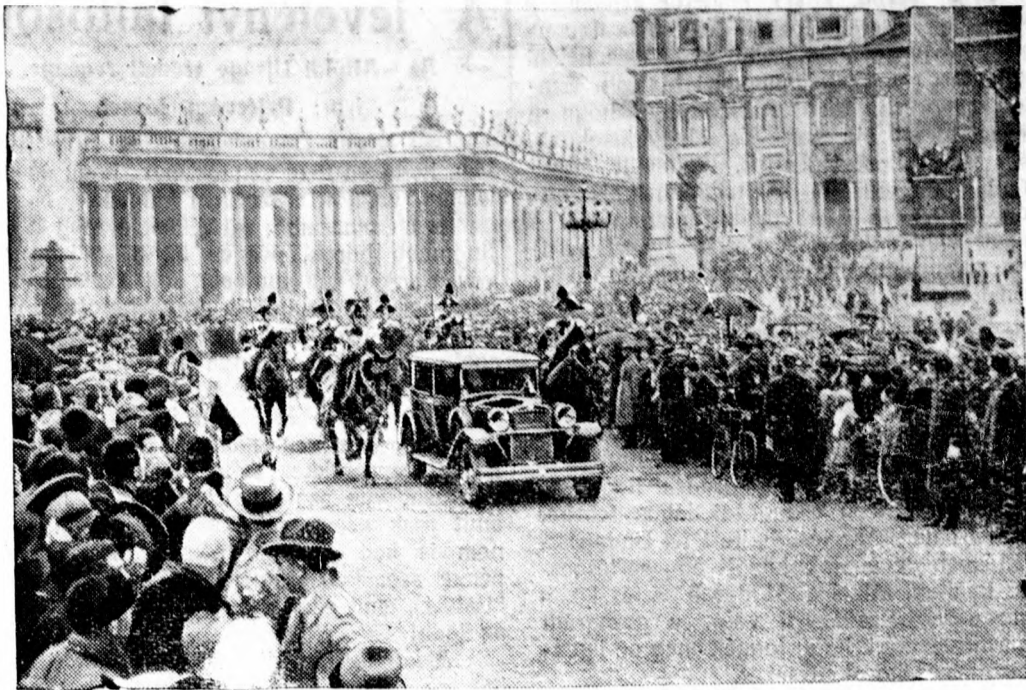
Mussolini látogatába megy a pápához.