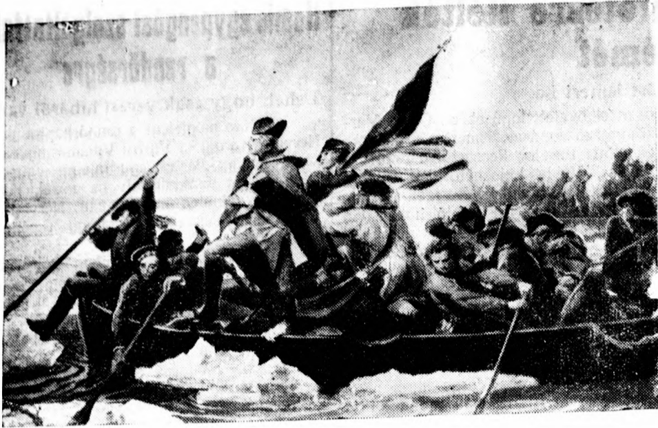
Most fedezték fel Németországban az egyik legértékesebb történelmi festményt Washingtonról. A kép azt a jelenetet ábrázolja, amikor Washington a megáradt Delaware-folyón csapataival átkel.