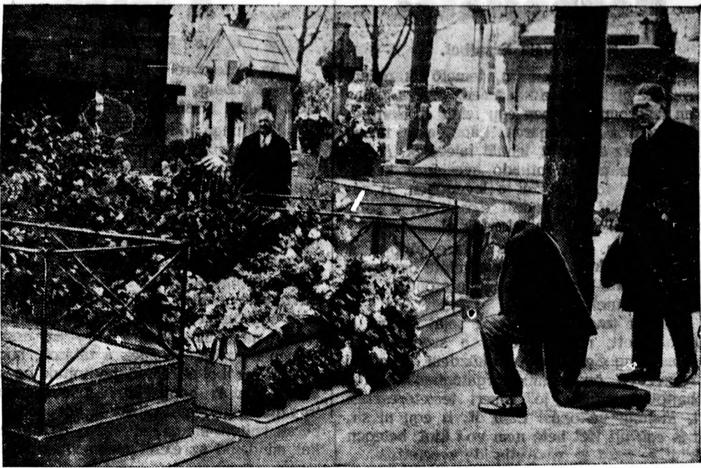
Kelelog amerikai államtitkár Franciaországban időzve fekereste Briand sirját, ahol ájtatos imába merülve róttá fe a kíváó franca álamférfi emléke iránt kijáó kegyeletet.

A divat, különösen a női divat, mindig igyekezett valami dekoratív és néha művészi hatással hódítani. Az is főtulajdonsága, hogy új, sőt minél újabb megjelenést produkáljon. De amikor a pipázó nők divatját igyekszik megalkotni, még csak ujat sem hozott, csak