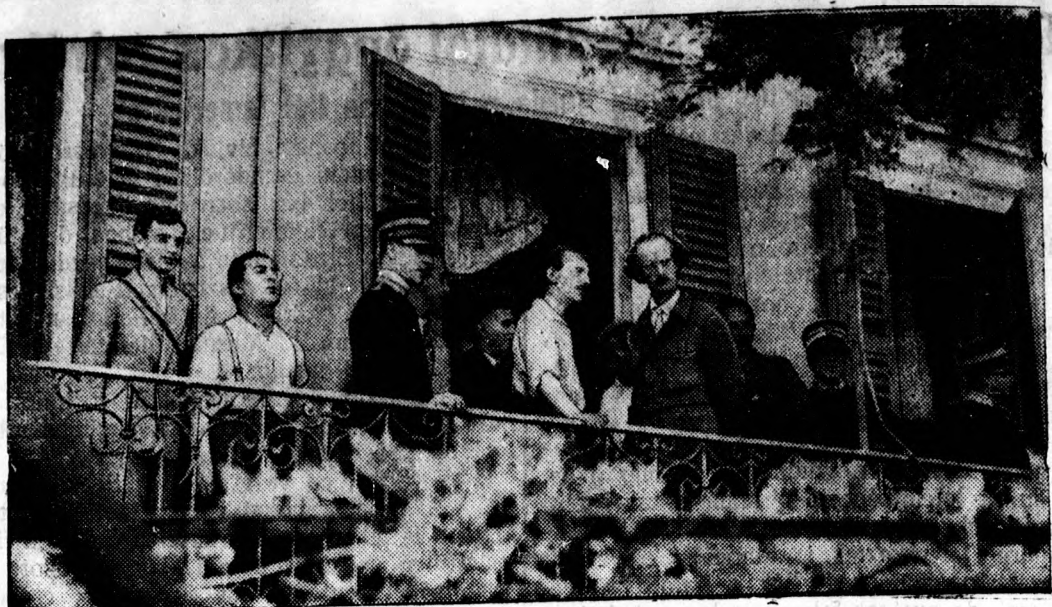
Piccard a második sikeres sztratoszférepülés után, olasz tiszték társaságában beszélget a légi utról.