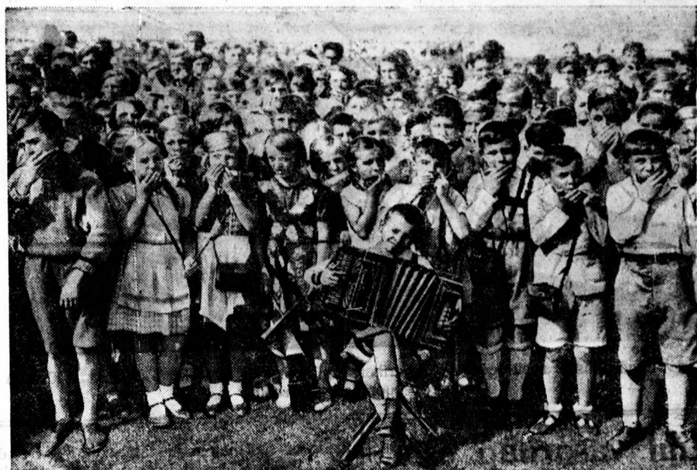
A német elemi iskolákban különböző zenekarokat szerveznek. Az egyik berlini szájharmo- monika-zenekar próba közben.