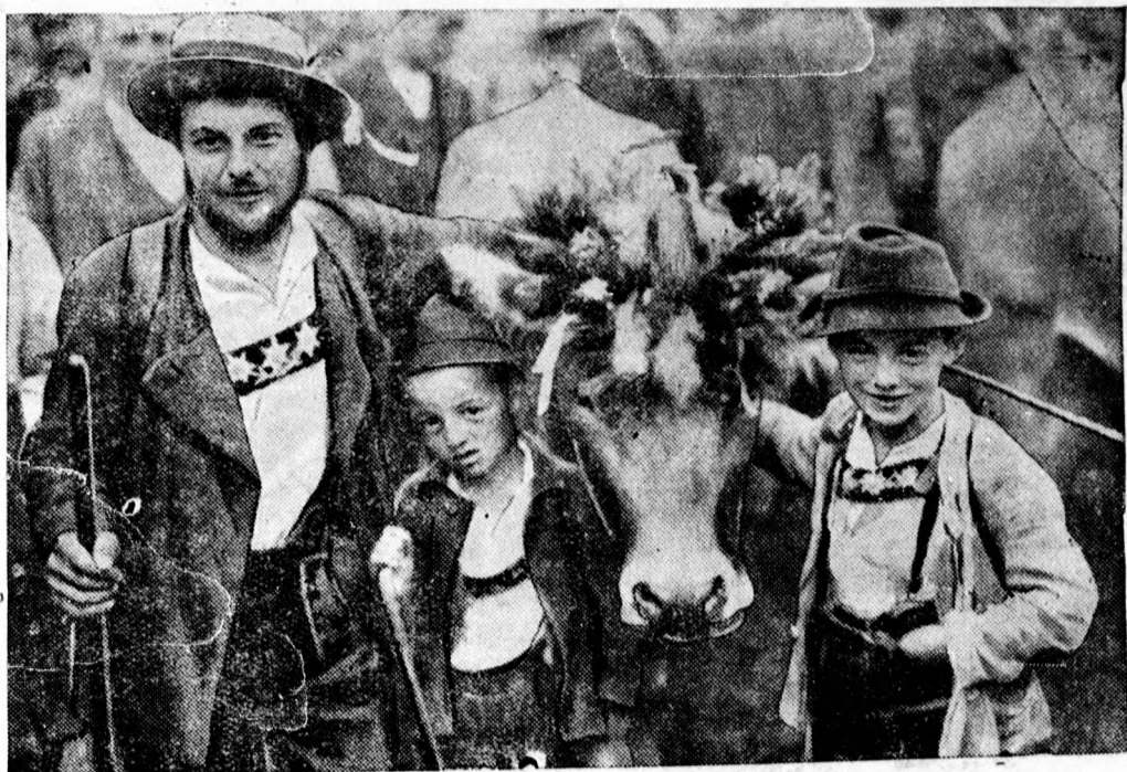
Bajos idill egy svájci faluból.

— Felhívás a MÁV-nyugdíjasokhoz. Felhívjuk a MÁV nyugdíjasokat, nyugbéréseiket és azok özvegyeit, hogy az 1933. esztendőre arcképes igazolványaik érvényesítésére arcképes igazolványaikat még október hónapban adják be az állomásfőnökségnél a szokásos kérvényt és a polgármesteri hivatal láttatásával.