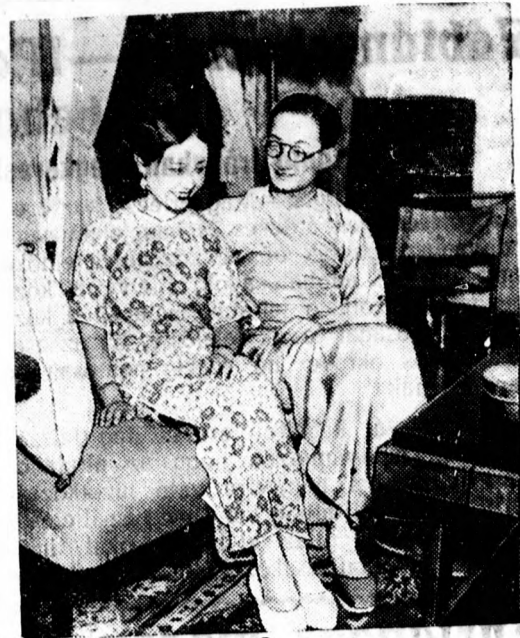
Jun-Chi, a mandzsuri császár sógora föld-körül nászuton fiatal feleségével.

Pedig, sajnos, a reál-gimnáziumi érettségi bizonyítvány is nagyon gyenge eszköz ahhoz, hogy vele az ifjuság el bírjon helyezkedni Eszterdőről-esztendőre ijesztő mértékben nő az elhelyezkedést, foglalkoztatást nem találó művelt fiatalság száma. A vezetőket mindennapi kegyér egyre kisebb lesz és azok, akik még meg bírnak belőle szerezni egy darabot, féltekényei örködnek azon, hogy elzárják a hozzávezető utat az életbe kitűnő fiatalok előtt.