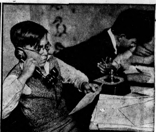
Egy német gyermekujás alapítása. Balról: Itt az új lap! — Jobbról: A »főszerkesztő ur« a legfrissebb telefonhíreket hallgatja.